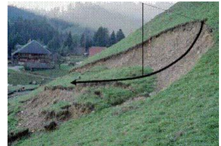
Hangrutsch im Feld

Ideale Voraussetzung ist ein Bachelorabschluss im Bauingenieur- oder Planungswesen. Absolventen anderer Fachrichtungen müssen mindestens über folgende Kenntnisse verfügen: