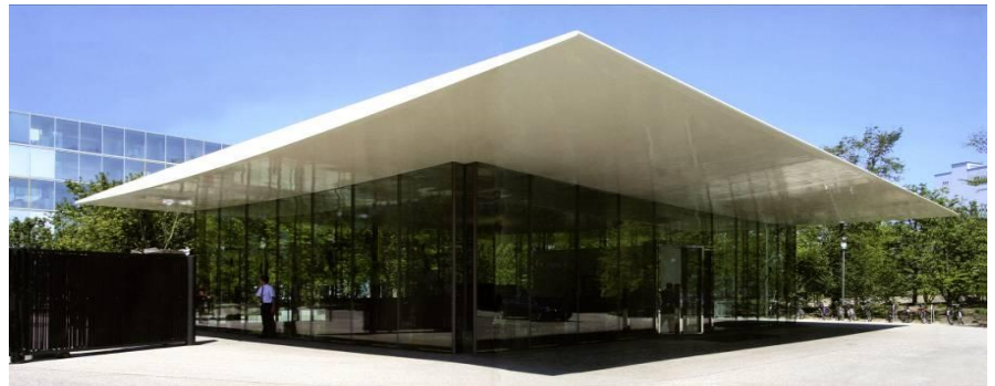
Porte Novartis, Basel: Dach in FVK auf Glaswänden (Entwicklungsstufe ZHAW)

Seit einigen Jahren kommt FVK auch bei Bauwerken, aber hauptsächlich in speziellen Situationen zur Anwendung: im Bereich aggressiver Medien (Ölplattformen, Kläranlagen, Werkstätten, Brückendecks), dort, wo die Elektrizität oder Funkstrahlung eine grosse Rolle spielen, bei Gebäudeverstärkungen und bei Bauwerken mit besonderer Architektur.