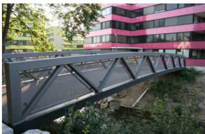
Scheccobrücke in Winterthur: Brücke in Verbundbauweise Stahl / FVK (Entwicklungsstufe ZHAW)

Faserverbundkunststoff (FVK) ist in den letzten Jahrzehnten weltweit ein wichtiger Baustoff geworden. Im Sport, Automobilbau, Bootsbau, aber auch im Flugzeugbau ist FVK nicht mehr wegzudenken.