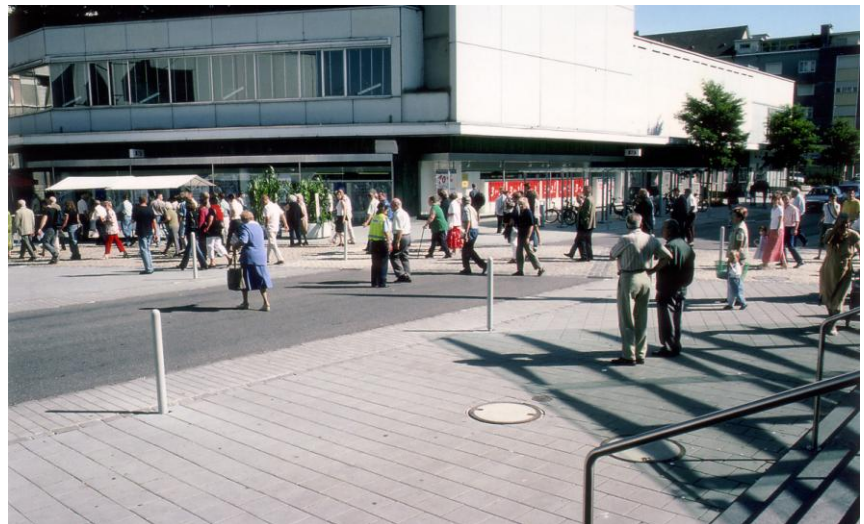
Zentrum Stadt Grenchen – Koexistenz auf der Kantonsstrasse

Strassenräume sind die wichtigsten Stadträume – dieses Verständnis war lange selbstverständlich. Man gestaltete multifunktional genutzte «Prachtsstrassen», noch heute die Visitenkarten der Städte. Mit