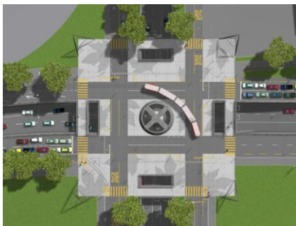
Stadtraum Wankdorfplatz in Bern